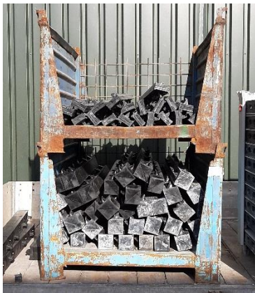
Pasplaten en hoekstaanders worden in de daarvoor bestemde kratten aangeleverd